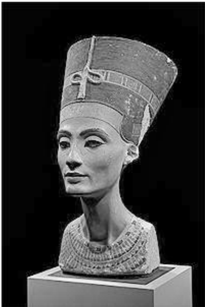
NEFERTITI - Jedna od najlepših žena Egipta

oči, a i današnjim ispitivanjima šminke, koja se po sastavu nije mnogo promenila od davnih vremena, neki naučnici su došli do zaključka da je surma opasna za oči, kao i za ceo organizam, jer može doći do taloženja olova u raznim organima. Surma sadrži antimonov ili olovni sulfid, a u Egiptu se koristi i malahit, karbonat bakra zelene boje, kome se dodavala čađ da bi se dobila tamno zelena ili skoro crna šminka za oči. Čim je utvrđeno da šminka sadrži olovo u bilo kom obliku, odmah je data preporuka da se ovo sredstvo za ulepšavanje (i lečenje?) očiju ne koristi. S obzirom da su infekcije oka bile ozbiljan problem u močvarnim područjima Nila, naučnici su se ponovo pozabavili sastavom šminke, da bi se utvrdilo da li je surma (koja ima različite nazive na Bliskom istoku i Aziji) zaista pomagala u sprečavanju ili lečenju infekcije oka. Prvo su pošli od toga da se dva spoja, olovo i hlorid, ne pojavljuju zajedno u prirodi, što znači, da je reč o proizvodu koji su spravljali „hemičari“, a rezultat je bio antibakterijsko svojstvo šminke. Kod Arapa je ova šminka prepisivana kao lek za oči još u 9. veku pre nove ere.