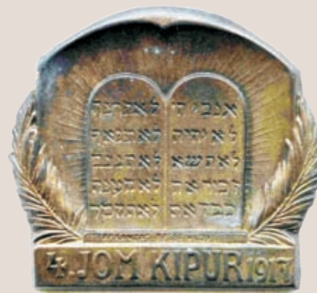
Austro-ugarska spomen značka »Yom Kipur« 1917, izdana u znak sećanja na najveći jevrejski praznik – dan pomirenja. סיכת הזיכרון האוסטרו-הונגרית של יום כיפור 1917, הונפקה לזכר היום הקדוש ביותר בלוח השנה העברי. An Austro-Hungarian »Yom Kippur« 1917 commemorative badge issues in the memory of the holiest Jewish holiday – the Day of Atonement.