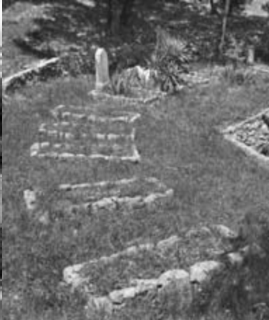
Groblje kod Gorjanskog za vreme prvog svetskog rata i 2011. godine. בית הקברות בגוריינסקו במלחמת העולם הראשונה ובשנת 2011 The cemetery near Gorjansko during the First World War and in the year 2011

Svetski rat 1914-1918 u konflikt je upleo čak 36 zemalja, pripadnike brojnih naroda, jezika i veroispovedi. Krvave borbe uz Soču (1915-1917) time su nosile višenacionalan i viševerški pečat. Među brojnim vojnicima austro-ugarske vojske i italijanske armade bili su zastupljeni takođe i Jevreji.