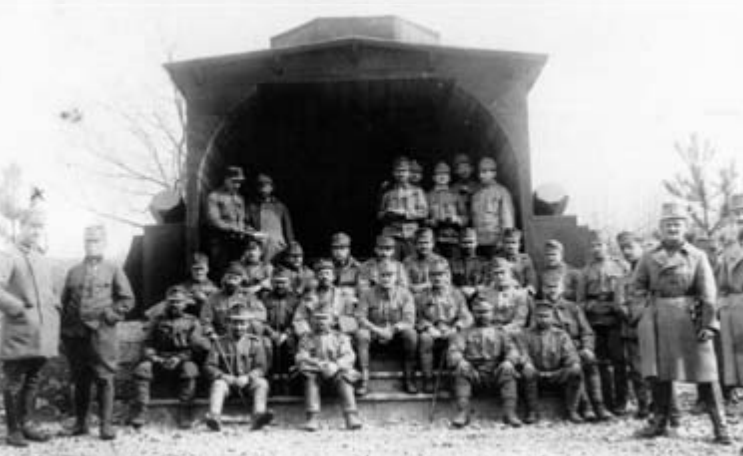
Drvena sinagoga koju su izgradili austro-ugarski vojnici na Doberdobskoj visoravni 1915. godine. בית כנסת מעץ, שבנה על ידי החיילים האוסטרו-הונגריים ברמה של דוברדוב בשנת 1915. A wooden synagogue made by Austro-Hungarian soldiers, on the plain of Doberdob/the Doberdo in 1915.