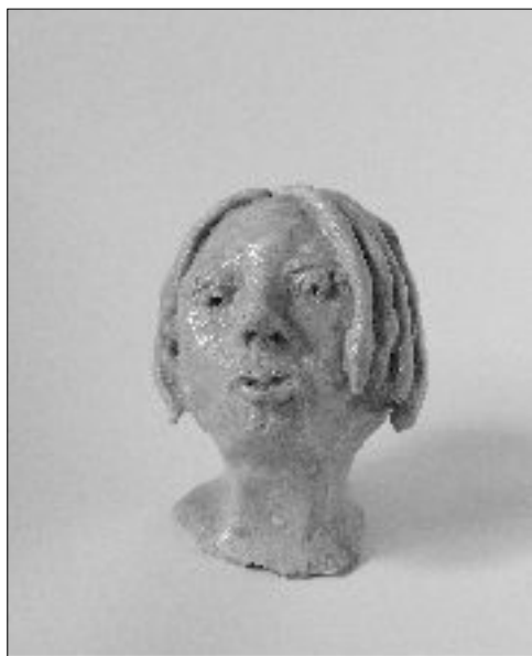
28. JASMINA, Ria Beherano