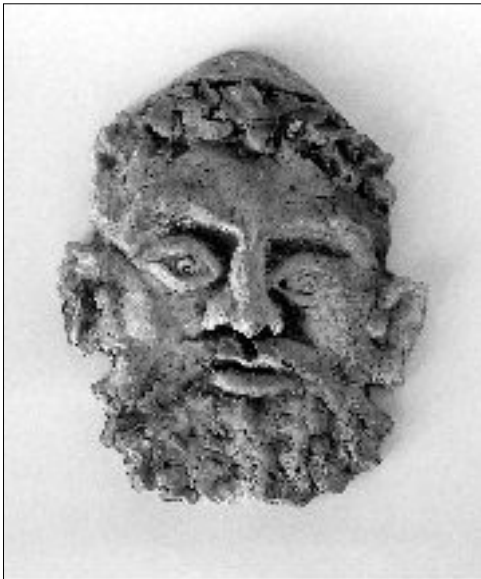
2. RABIN, Jovan or evi