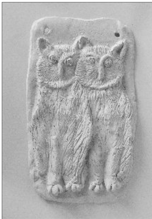
25. DVE SOVE, Vesna Radinovi