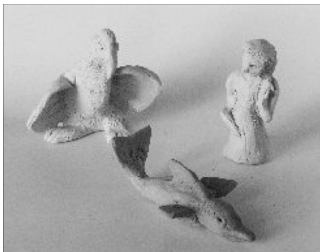
15. FIGURE, de iji radovi