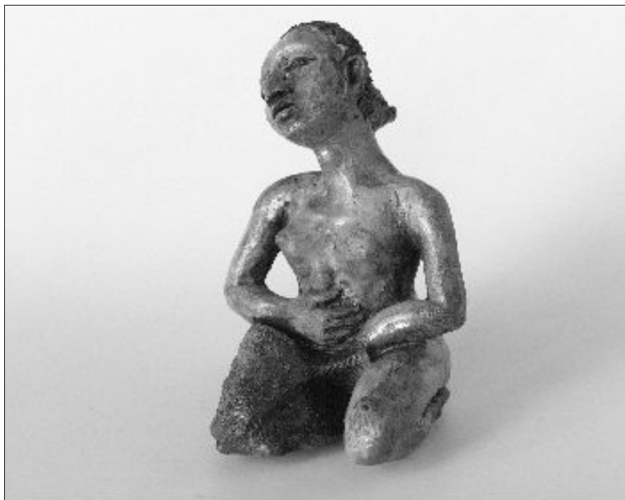
22. DEVOJKA, Jovan or evi