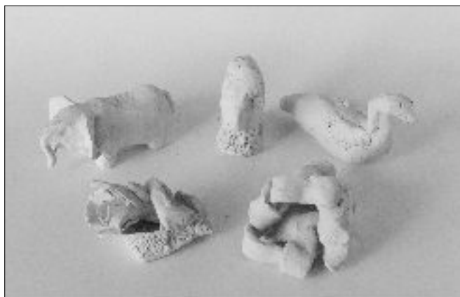
26. FIGURE, de iji radovi