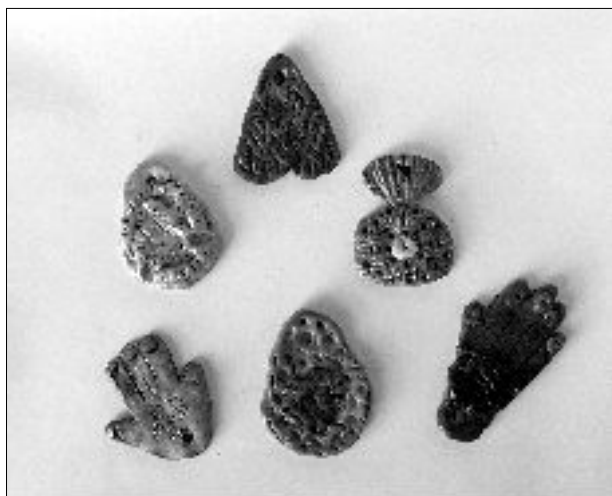
21. PRIVESCI, Vesna Radinovi