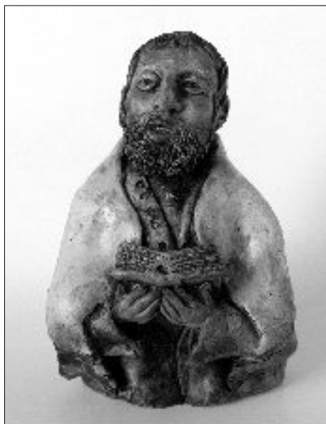
7. MOLITVA, Jovan or evi