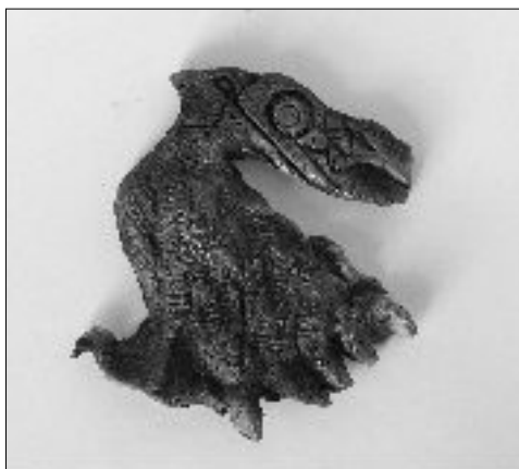
20. PTICA, Rahela or evi