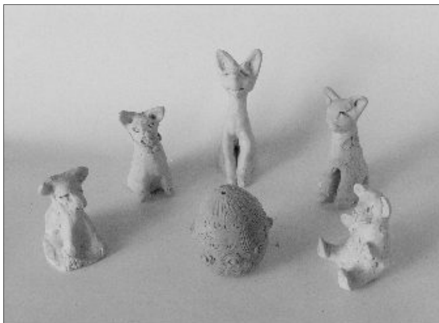
27. FIGURE, de iji radovi