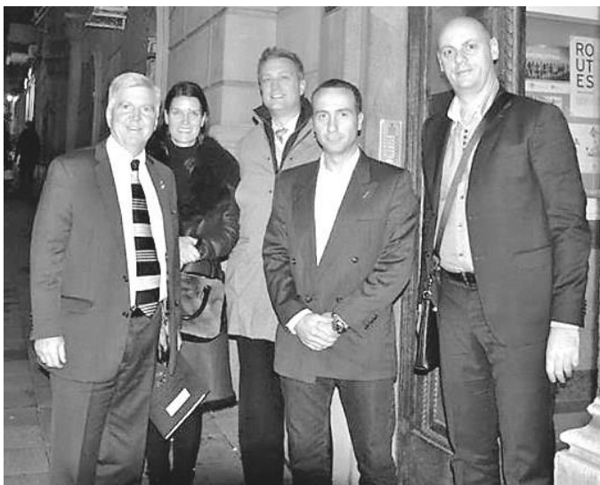
Američkog ambasadora Kajla Skata, prvi s leva, dočekali su predstavnici JOB-a

Američki ambasador Kajl Skat bio je gost Jevrejske opštine Beograd, na 134. godišnjicu uspostavljanja diplomatskih odnosa Srbije i SAD.