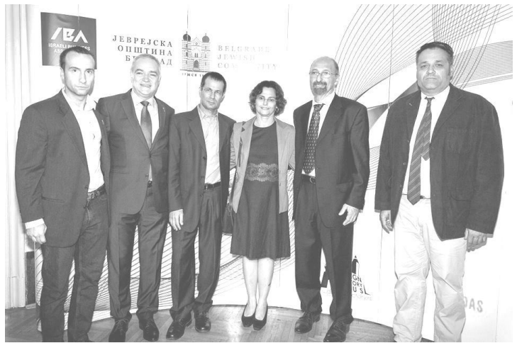
Ambasadorka Izraela u društvu sa rukovodstvom JOB