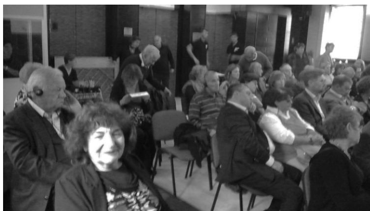
Na svečanostima u Sarajevu moglo je da se vidi dosta gostiju iz Izraela

Poslje završenog programa priredjen je svečani koktel, a osoblju pozorišta je trebalo puno vremena da isprazne prostorije od mnogobrojne publike koja se polako udaljavala i nastavljala proslavu u privatnim krugovima.