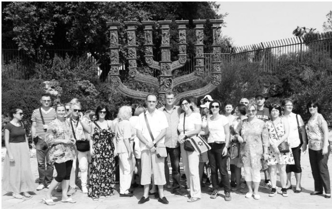
Kraljevčani u poseti Knesetu

„Ljudi su oduševljeni svim onim što su videli, a za relativno male pare. Od juče po podne me zovu puni impresija, prezadovoljni. Veliku ulogu odigrao je vodič Andrej, da njega nije bilo, ne bi to bilo tako...“, napisao nam je Zoran Nikolić po povratku u Srbiju.