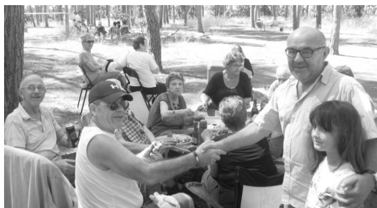
Mnogi od nas su zato i došli, da se sretnemo sa prijateljima s kojima nismo bili u kontaktu od prošle proslave Sukota.