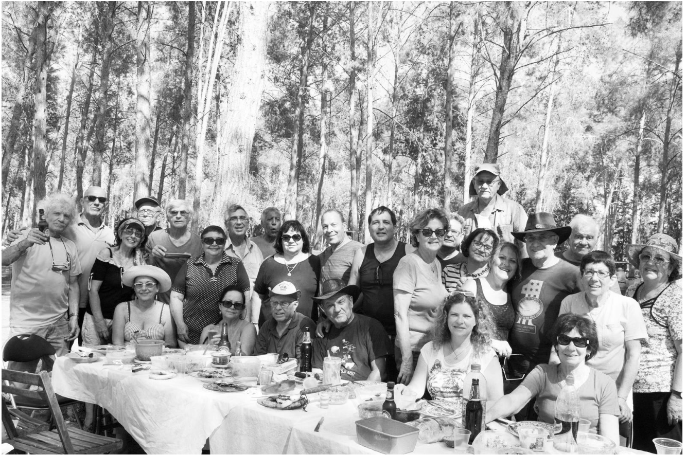
Ko kaže da nam nije lepo kada smo zajedno!