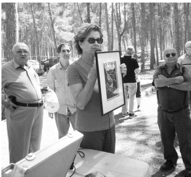
Ponuđena intarzija je izazvala interesovanje prisutnih i na aukcijskoj prodaji postigla je dobru cenu!