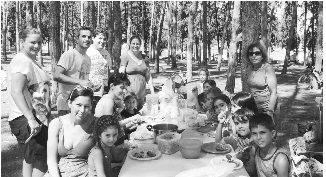
Prvo jedu deca, a za ostale... pa, po mirisu roštilja koji se širio uokolo bilo je dovoljno hrane za sve.