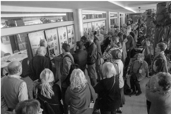
Izložbu je video veliki broj posetilaca

U organizaciji Jevrejske zajednice Crne Gore izložba „Nestali u Holokaustu – Zemun svaka slika priča priču“ postavljena je u KIC „Budo Tomović“ u Podgorici. Simbolično, izložba koja podseća na stradanje Jevreja tokom Drugog svetskog rata je postavljena u centru koji nosi ime narodnog heroja Bude Tomovića koji je poginuo 1942. godine. Nestvarno zvuči podatak da se u centru Podgorice ukrštaju ulice Josipa Broza Tita i Pete proleterske brigade, Bulevar revolucije sa Bulevarom Save Kovačevića, 27. Marta sa ulicom 4. jula, Bratstvo i jedinstvo pogledom traži ulice Žrtava fašizma i 13. jula, i da ne nabrajam dalje, sve ove nazive ulica koje je vlast u Beogradu odavno zamenila sa „kraljicama i kraljevima“. Sprem'ite se sprem'ite četnici, čekaju i vas poneke zaboravljene ulice narodnih heroja Jugoslavije da ih zamenite.