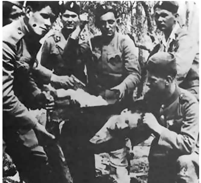
Ustaše spremne za klanje dece - arhivski snimak

Ali čak i da ima nekakvih povijesnih tragova sloganu Za dom spremni, karakter i zločinačka praksa te marionetske fašističke države izbacila ga je iz civiliziranog društva za sva vremena.