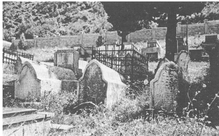
Staro jevrejsko groblje u Mostaru