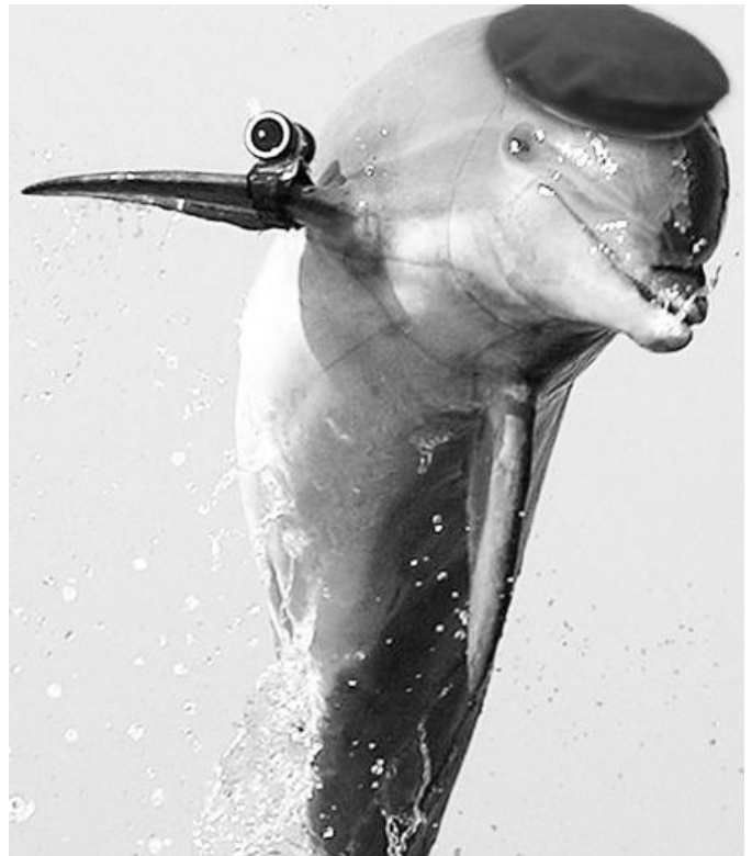
Delfin špijun – ilustracija

A kako je otkriven delfin špijun? Čudno se kretao, svaki čas je iskakao iz vode, plivao tamo, onamo i mornarički komandosi su shvatili da će delfin kada zaroni otkriti njihovu podmorničku bazu i o tome obavestiti izraelsku obaveštajnu službu. A i to mi je neka tajna, pa ceo svet zna da Hamasovci imaju tri podmornice koje koriste za ulov ribe, znači u miroljubive svrhe. I zašto bi onda Izraelci od toga pravili problem. Znamo mi već da Hamasovski džihad ima i rakete, minobacače i da ne nabrajamo koja sve oružja, ali sve je to u miroljubive svrhe. Ne daj Bože da bi oni to ispalili na nezaštićena izraelska civilna naselja.