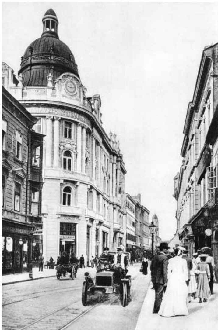
zgrada banke i kavane Corso