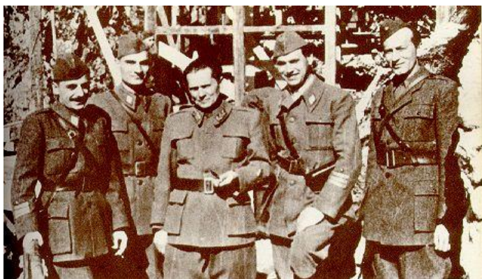
Tito (u sredini) sa saborcima 1944. u Drvaru, snimljeno neposredno pred nemačku invaziju na partizanski vrhovni štab

operišu ruski lekari. Nakon operacije Titu nije bilo dobro. Osećao je strašne bolove, rana se zagnojila i posumnjalo se da su ruski lekari izvršili operaciju zatrovanim instrumentima. Prema kazivanju Generala Žeželja, koji je bio prisutan u vili na Brdu kod Kranja, rusi su se ponašali izgubljeno, puno su pili i pušili, podnapiti su bauljali po vili, bili su nervozni i Žeželj ih je jednog momenta zaključao u sobu i pozvao Titove lekare, koji su odmah obavili novu operaciju. Ruski lekari su, navodno, vraćeni u mrtvačkim sanducima.