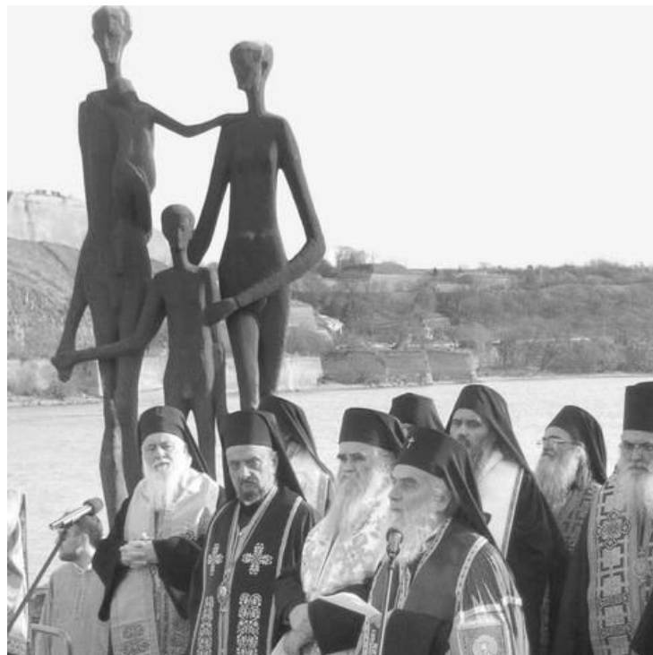
Ovde nije bilo mesta za izraelskog i mađarskog ambasadora

Nakon intervencije, ne zna se čije, na plato je pušten Efraim Zurof, koji je rekao da postoje oni koji bi želeli da se ovakvi zločini zaborave, ali što je još gore, ima onih koji ovakve zločine opravdavaju i njegove učesnike proglašavaju za nacionalne heroje (Dnevnik, Novi Sad).