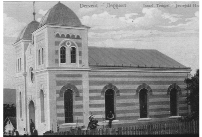
SINAGOGA U DERVENTI NA RAZGLEDNICI

Nije poznato gdje je bio raniji prostor za molitvu, ali je zajednica, koja je brojno rasla početkom XX stoljeća, odlučila podići stalnu bogomolju, koja je bila završena i posvećena 1911. godine. Nova je sinagoga bila relativno skromnih dimenzija, ali u skladnim proporcijama u Neo-Mavarskom stilu, koji je tada bio dominirajući i kojim je Austro-Ugarska nastojala obelježiti svoju jedinu koloniju – gotovo sve sinagoge u Bosni su tokom Austro-Ugarske okupacije i kasnije aneksije bile podizane u tom stilu.